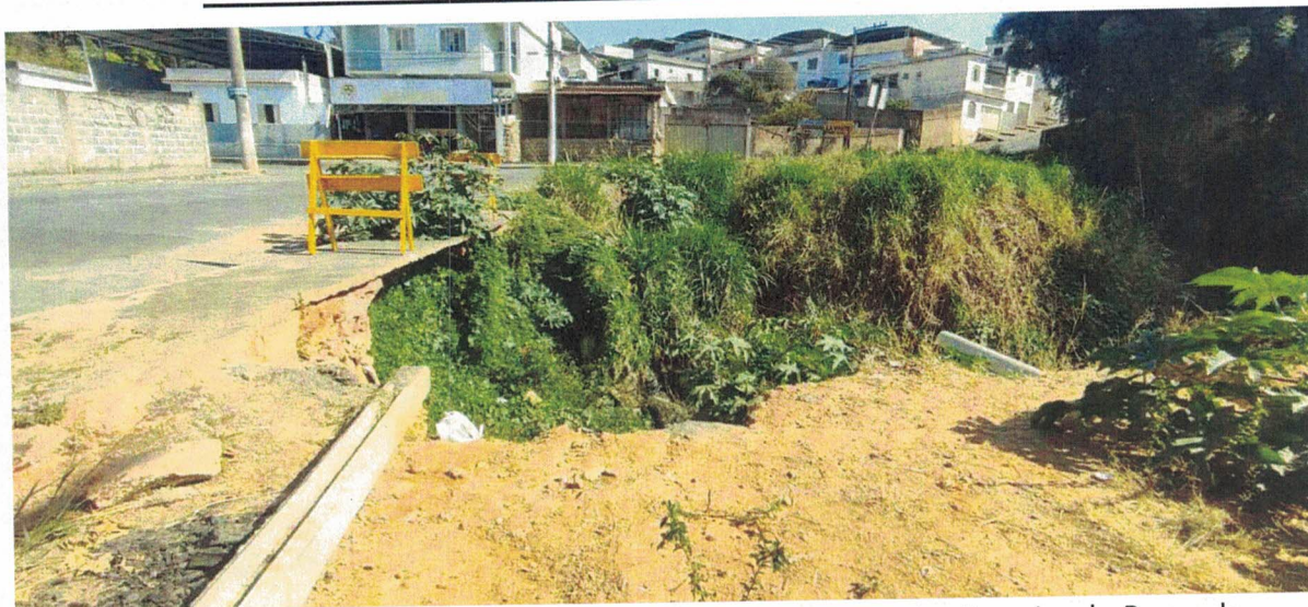
Foto 1 – Vista do processo erosivo a confluência das ruas Joaquim Ferreira de Rezende e Flauzino Vaz da Silva. ✓

Rua Barão de Piumhi, nº 53, 2º andar Centro – Formiga – MG – CEP: 35570-128 Contato: (37) 3329-1846 secretariafgadeobrasetransito@gmail.com