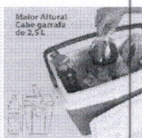
Maior Altura Cabe garrafas de 2,5L