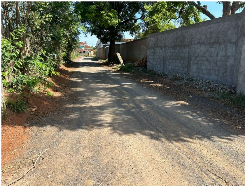
Figura 5 – Trevo