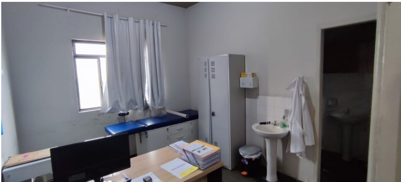
Figura 9 – Consultório Medico