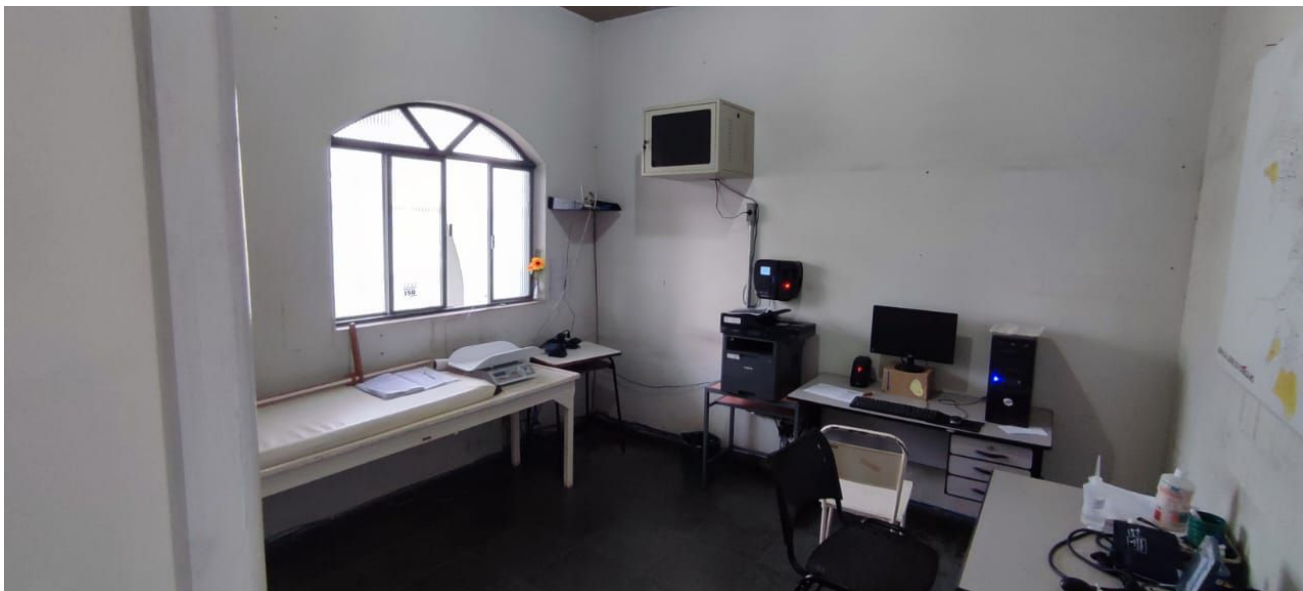
Figura 3 – Secretaria.