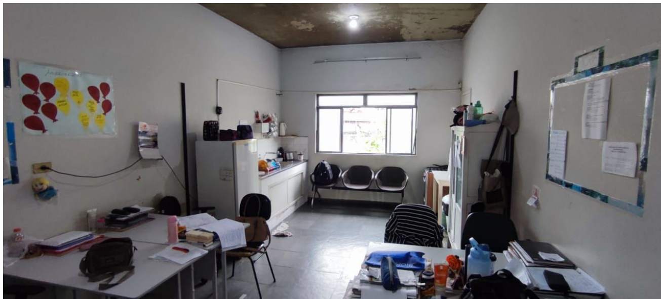
Figura 11 – Administrativo