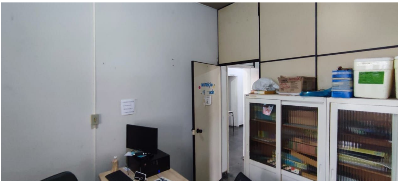
Figura 4 – Sala de curativo.