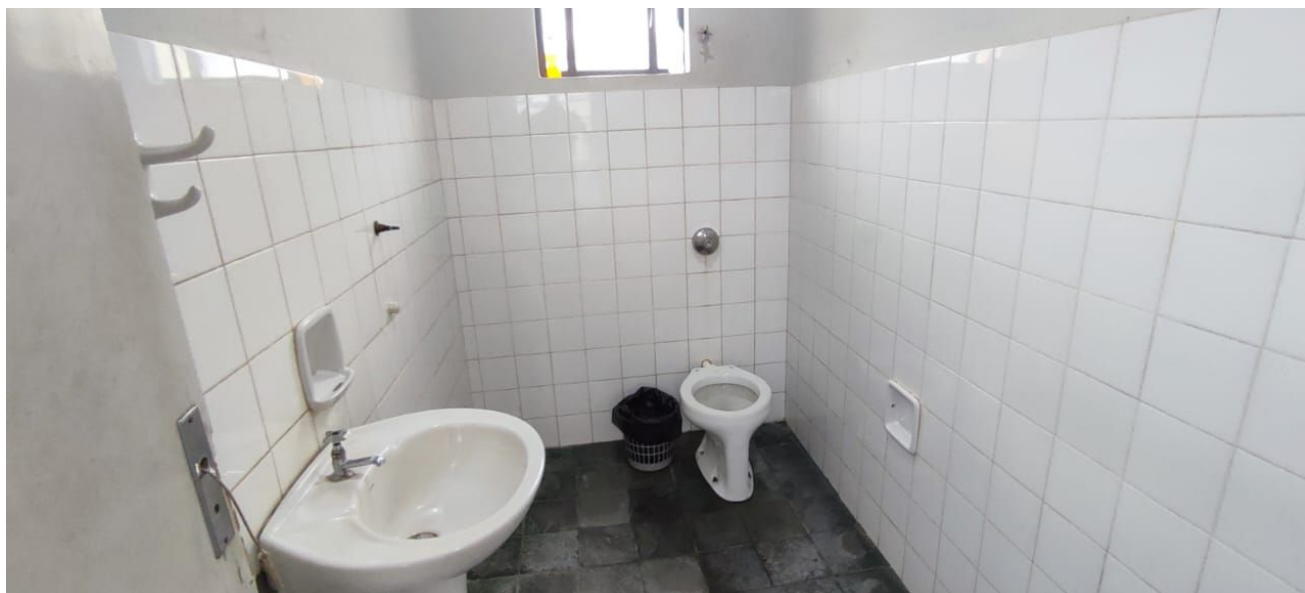
Figura 16 – Banheiro Social.