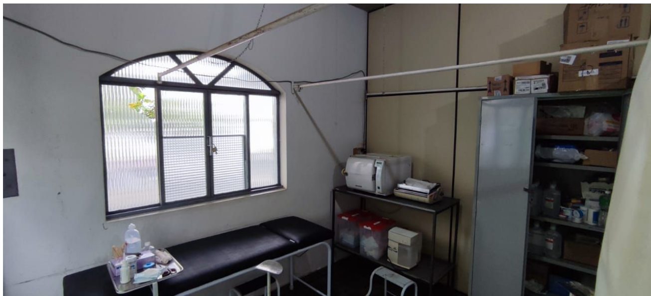
Figura 7 – Sala de Curativos.