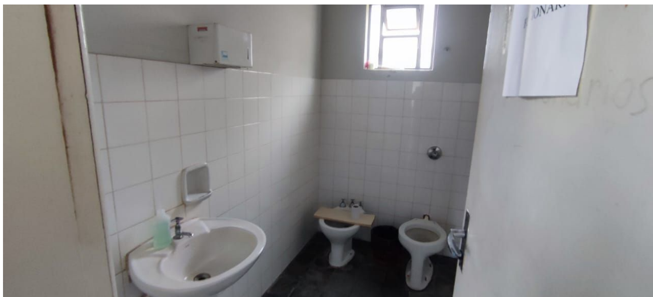
Figura 14 – Banheiro Funcionários.