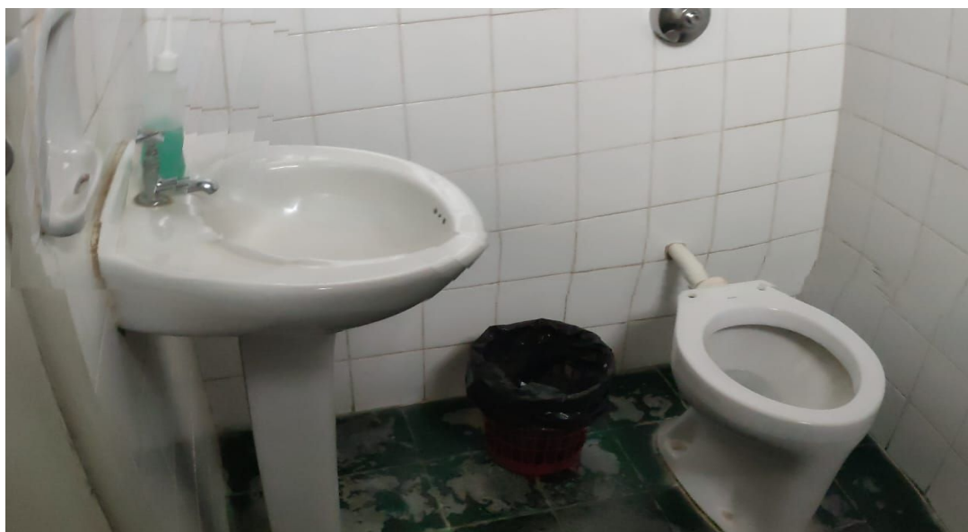
Figura 12 – Banheiro Consultório Médico 02