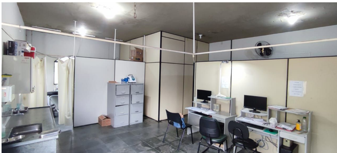
Figura 8 – Consultório Médico.