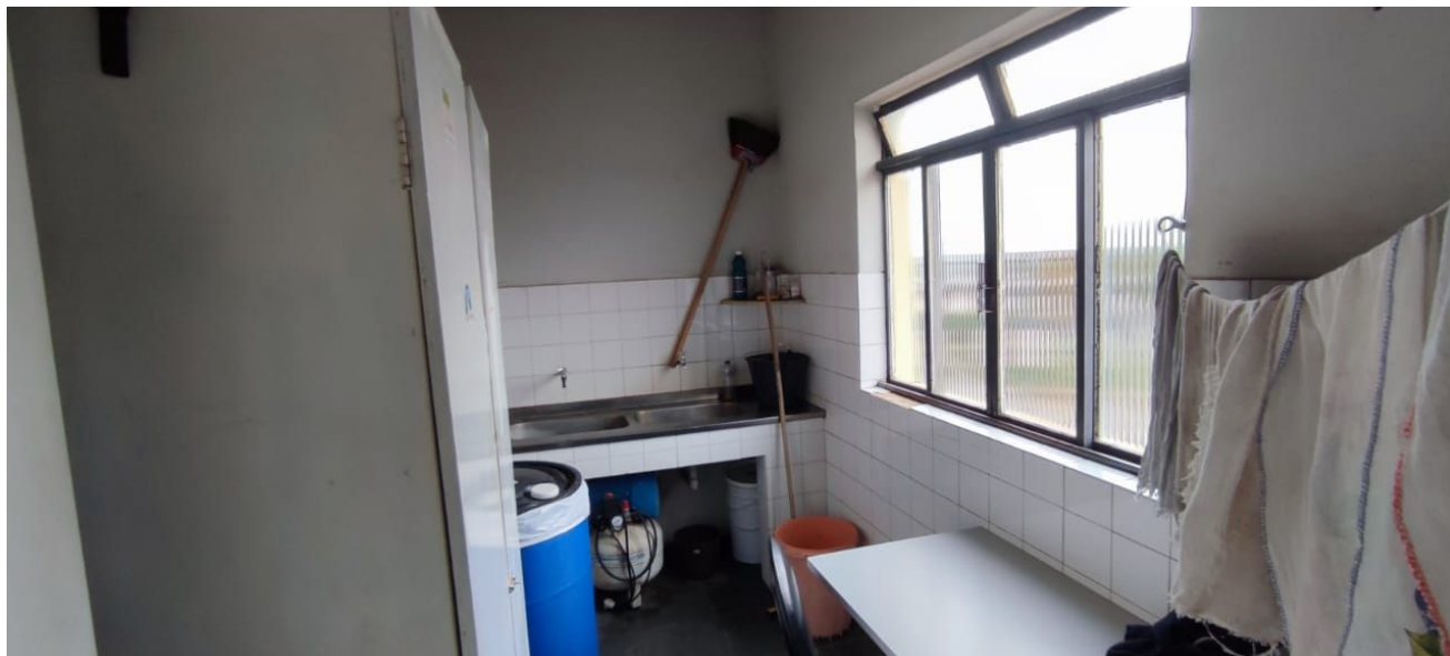
Figura 17 – Cozinha.