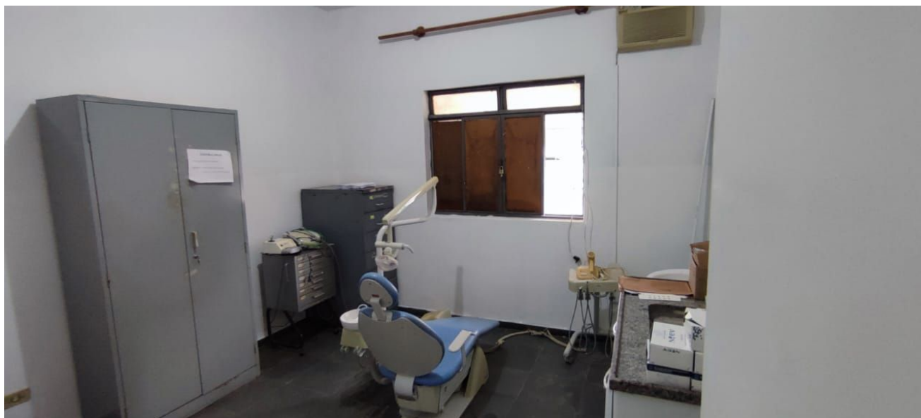
Figura 6 – Consultório Odontológico.