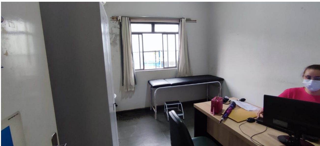
Figura 10 – Consultório Médico 02