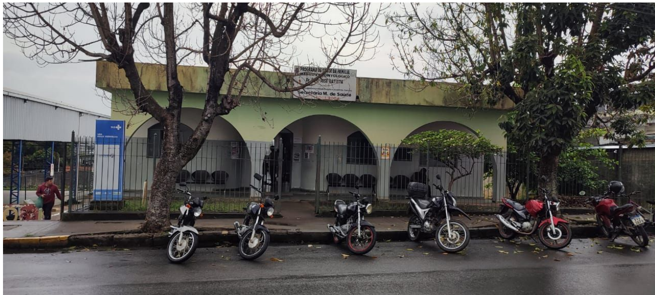
Figura 1 – Fachada frontal.