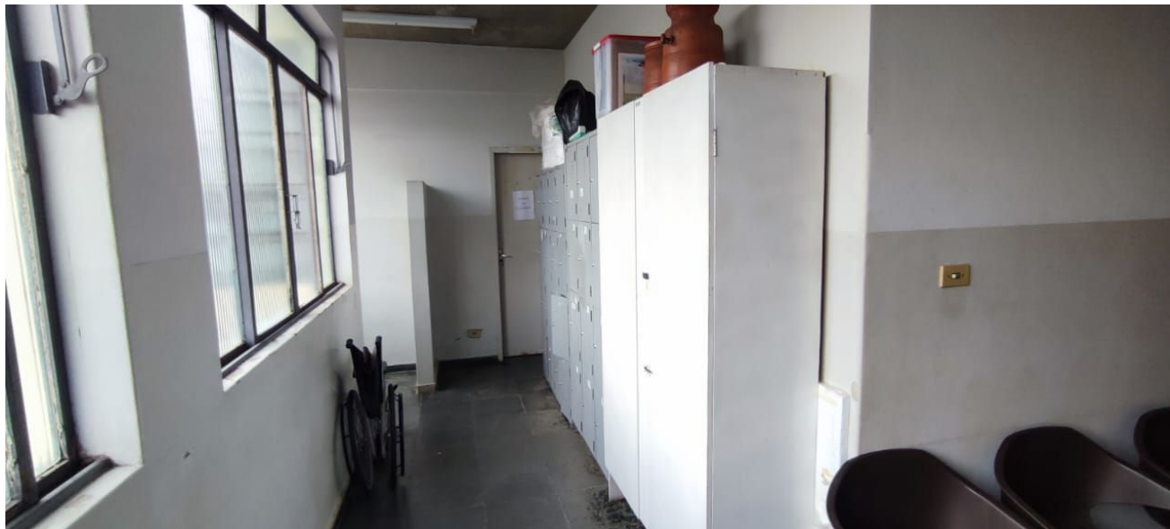
Figura 13 – Corredor de acesso banheiro funcionários.