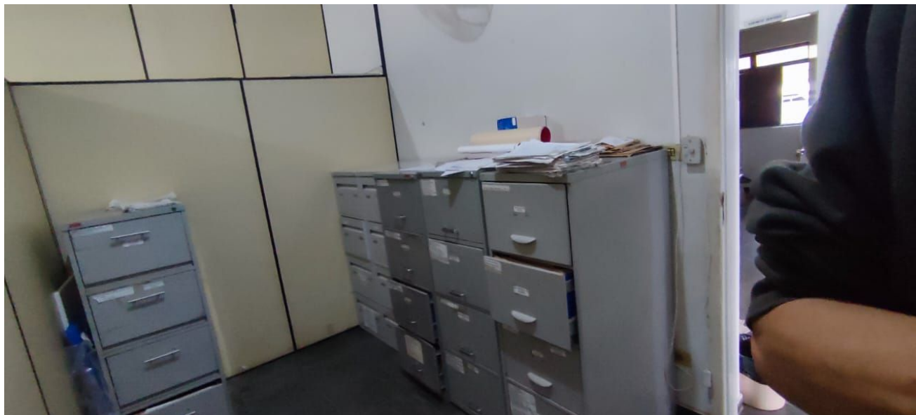
Figura 15 – Arquivo.