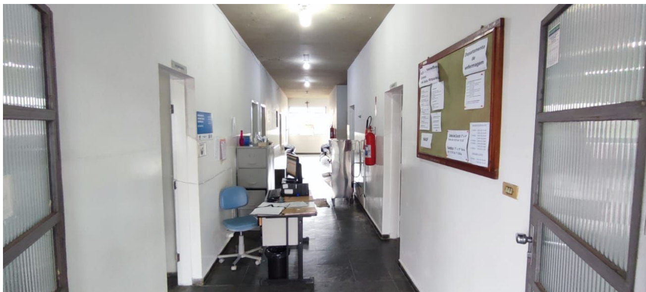
Figura 2 – Recepção