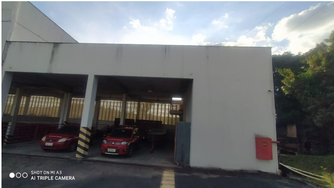
Figura 11 - Vista frontal prontidão superior