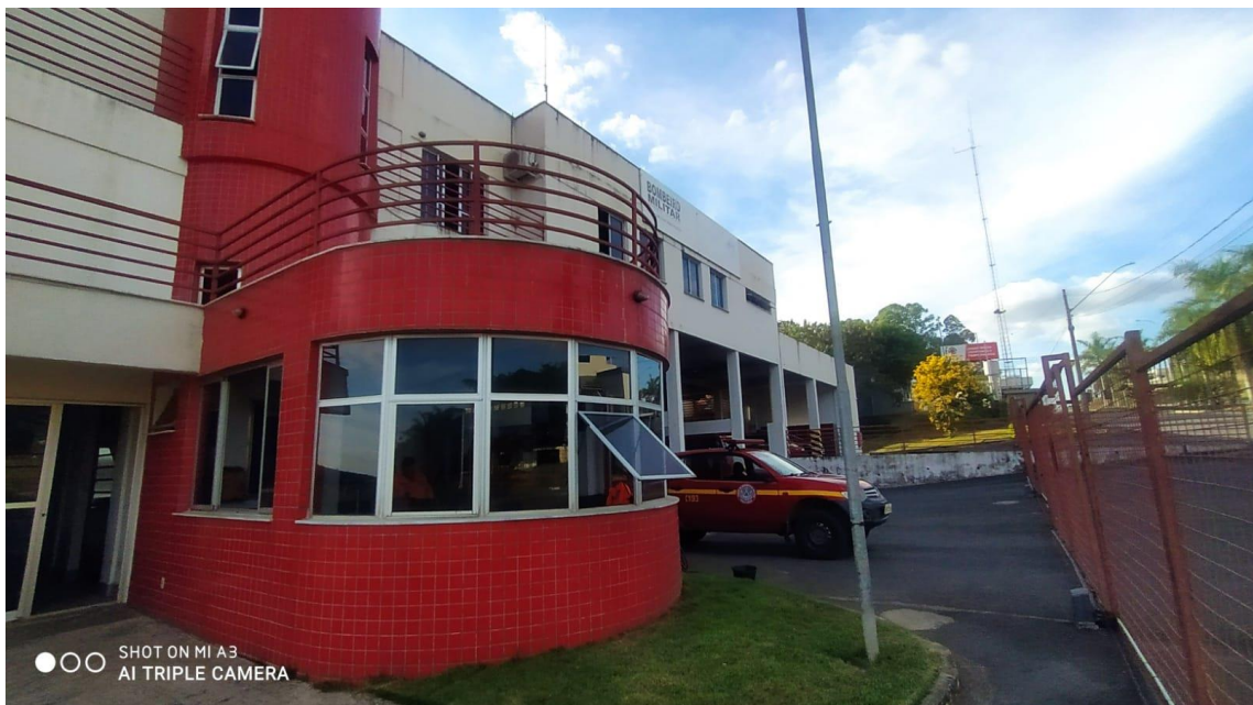
Figura 4 - Vista guarita