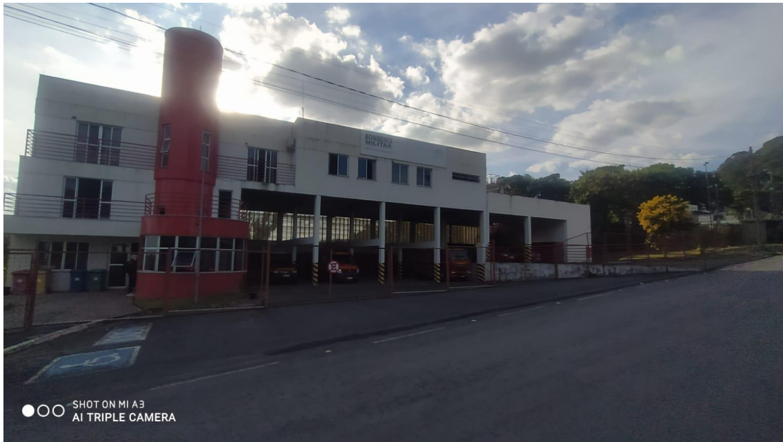
Figura 1 - Vista frontal