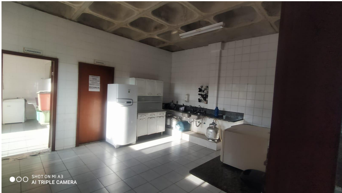
Figura 18 - Cozinha