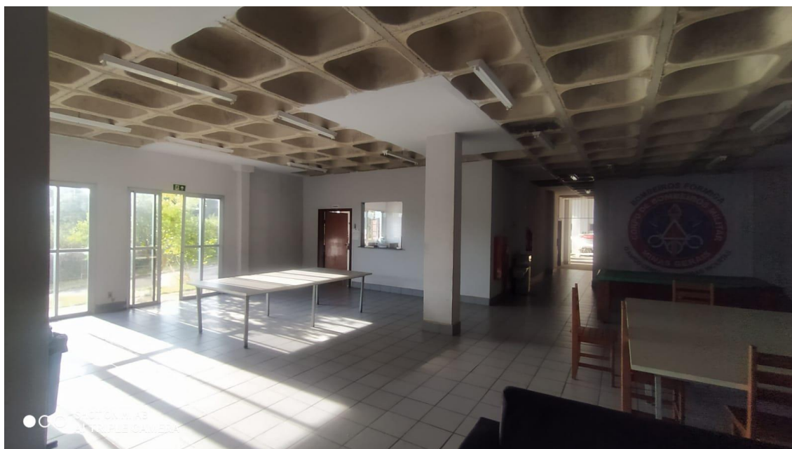
Figura 17 - Sala Lazer, Jogos, TV e Refeitório