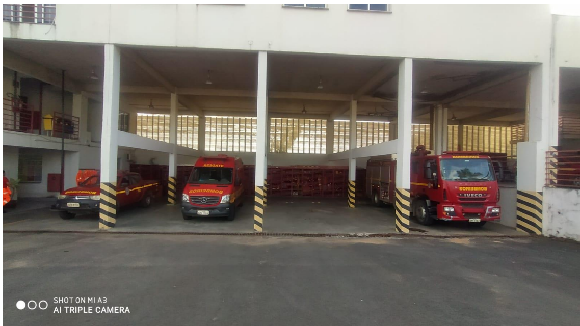
Figura 10 - Vista frontal prontidão inferior