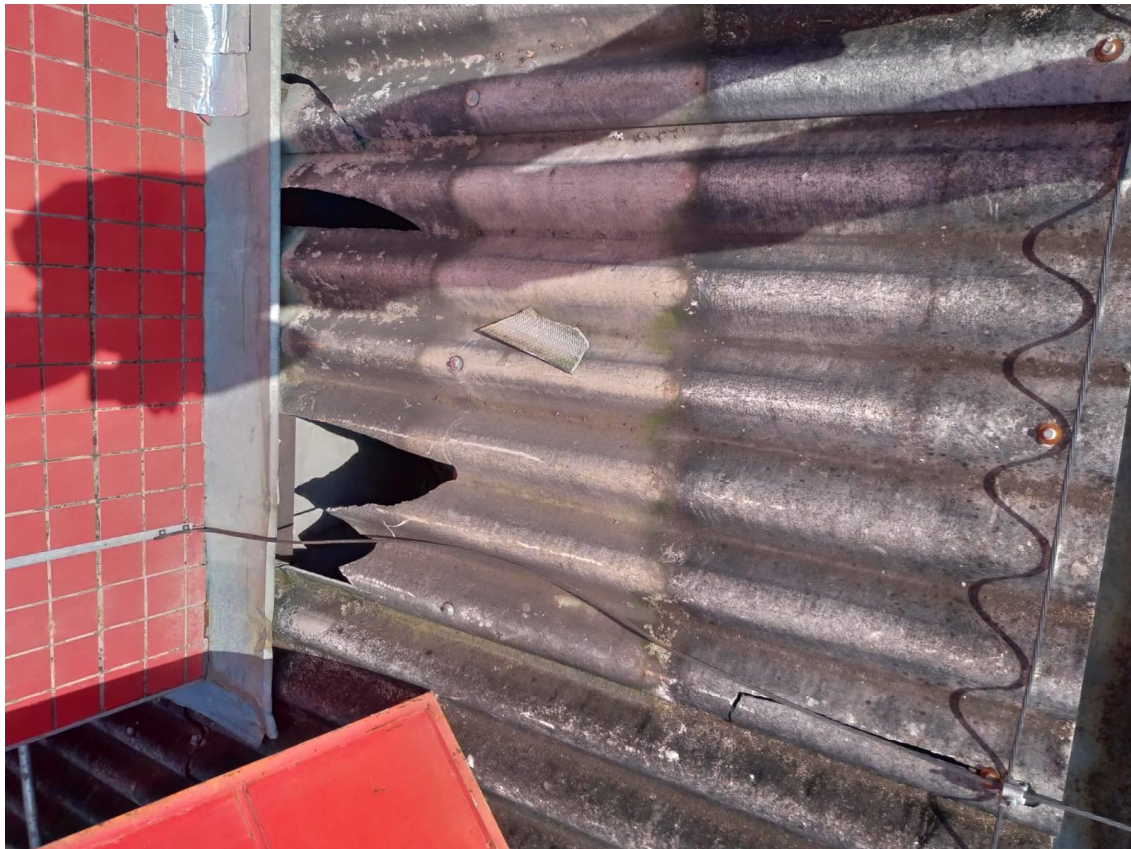
Figura 13 - Telhado danificado