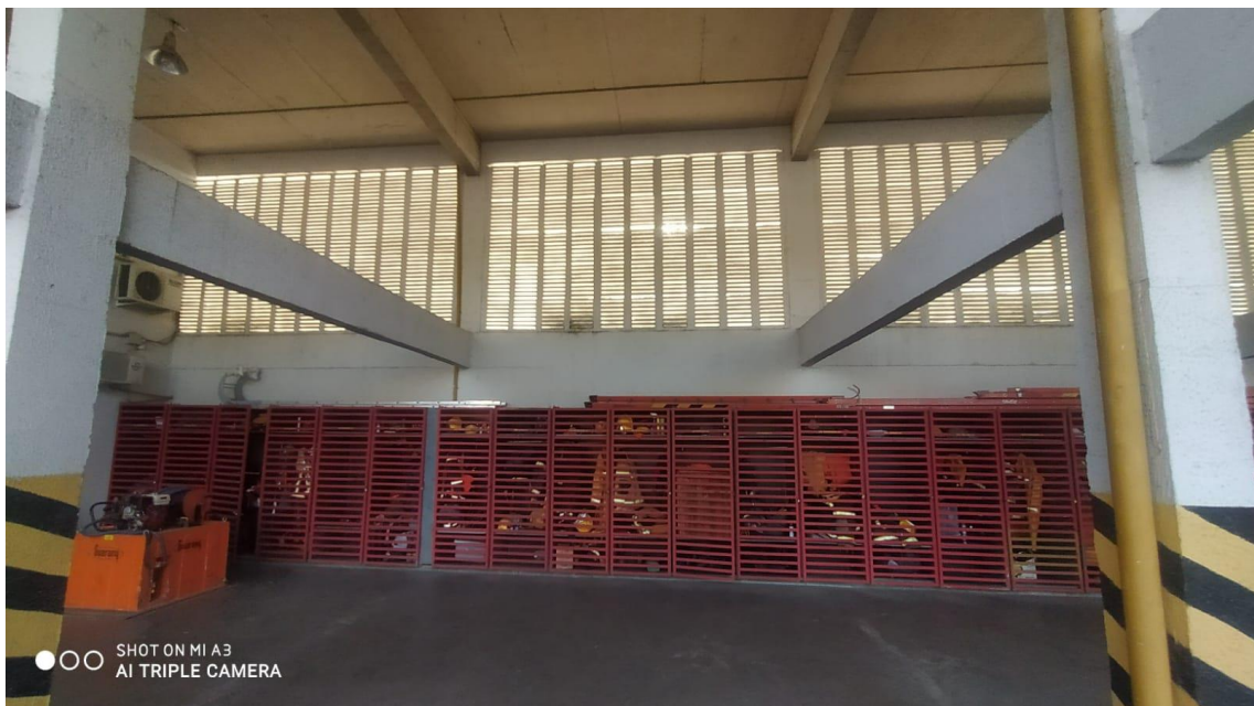
Figura 6 - Vista prontidão inferior