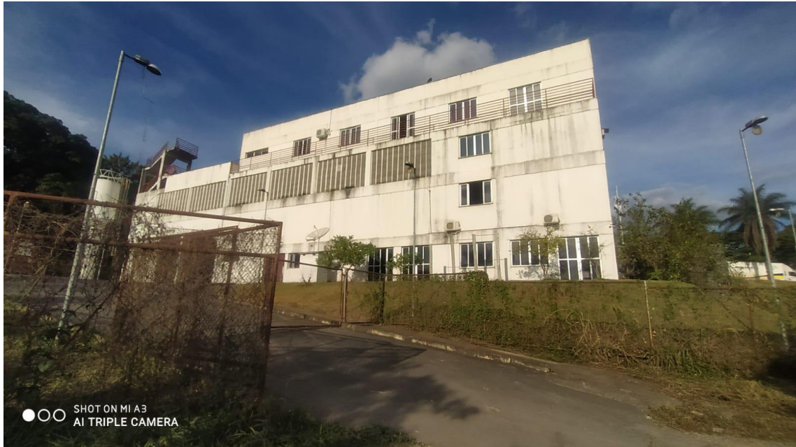
Figura 3 - Vista fundos