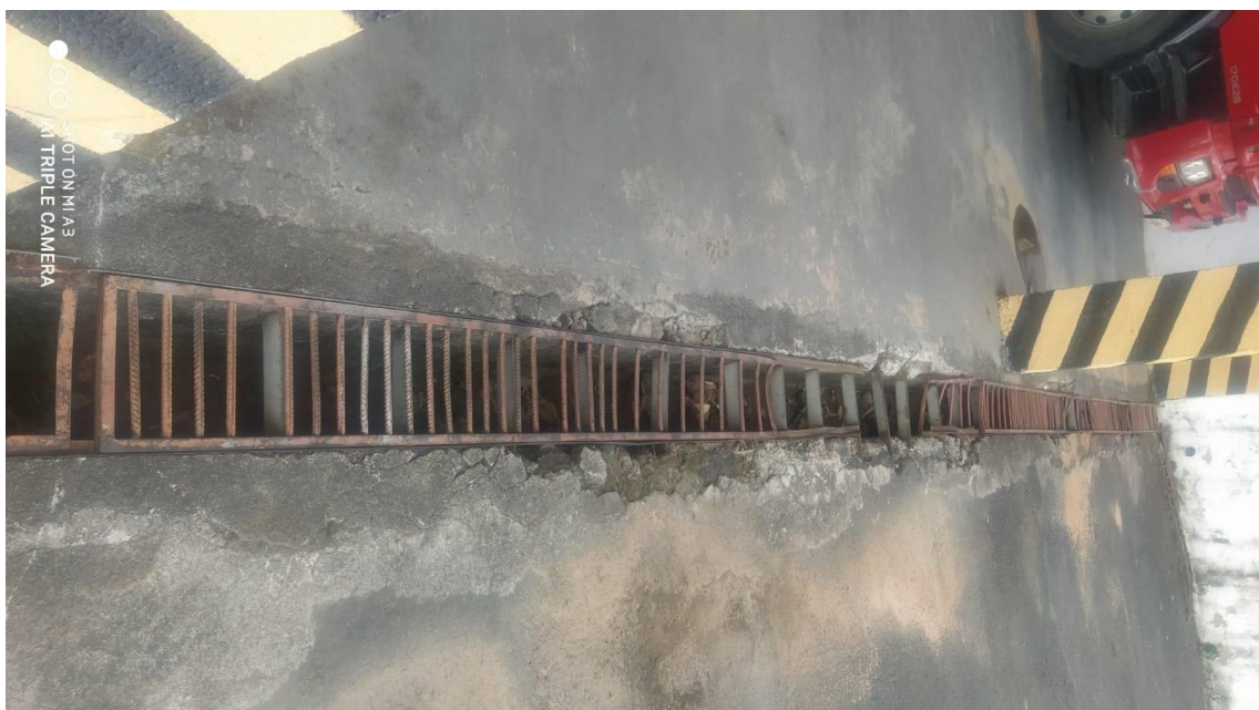
Figura 12 - Grelha danificada