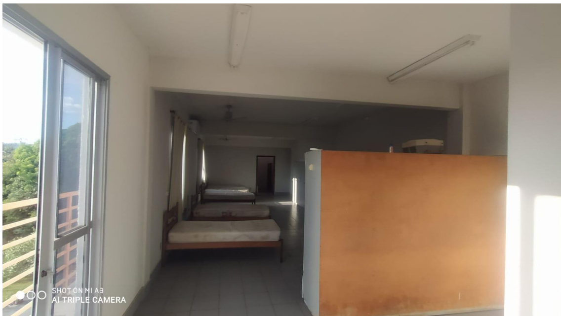
Figura 19 - Alojamento