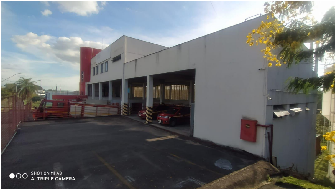
Figura 5 - Vista lateral direita