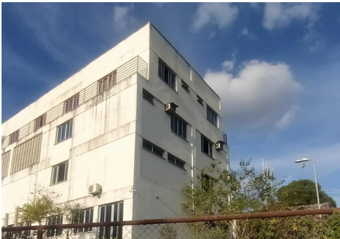
Figura 2 - Vista lateral esquerda