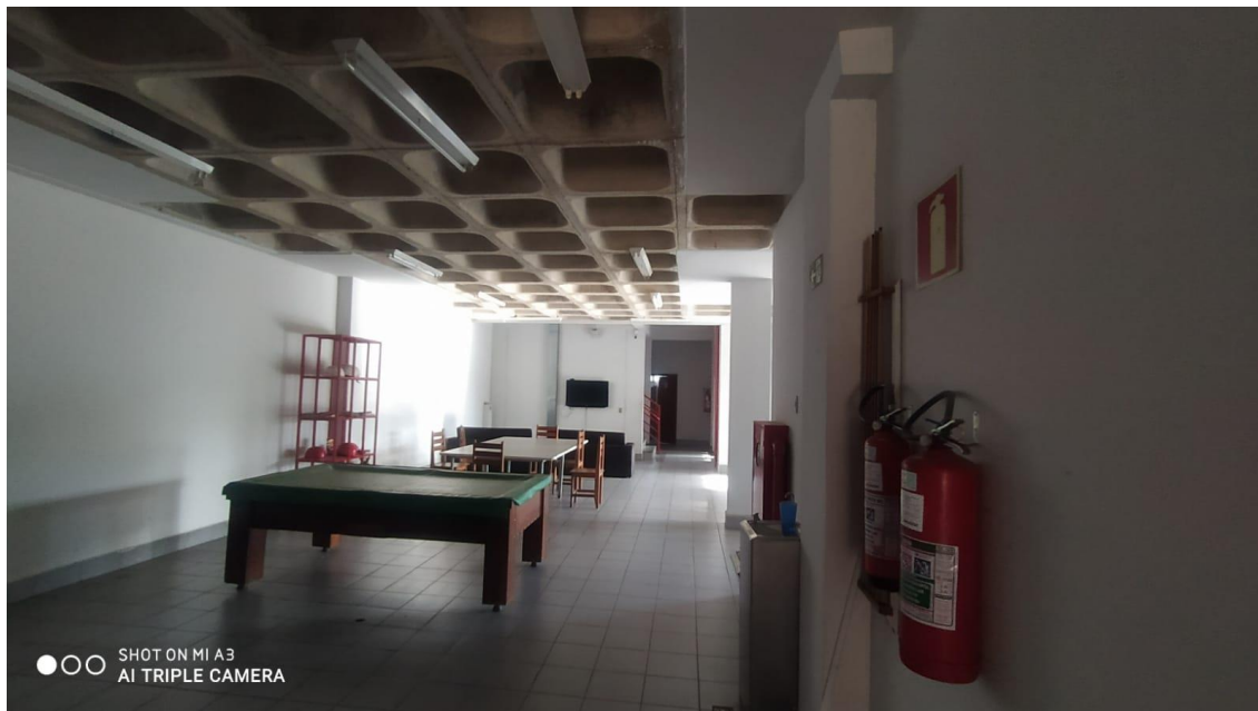
Figura 16 - Sala Lazer, Jogos, TV e Refeitório