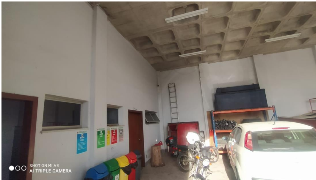
Figura 14 - Garagem inferior