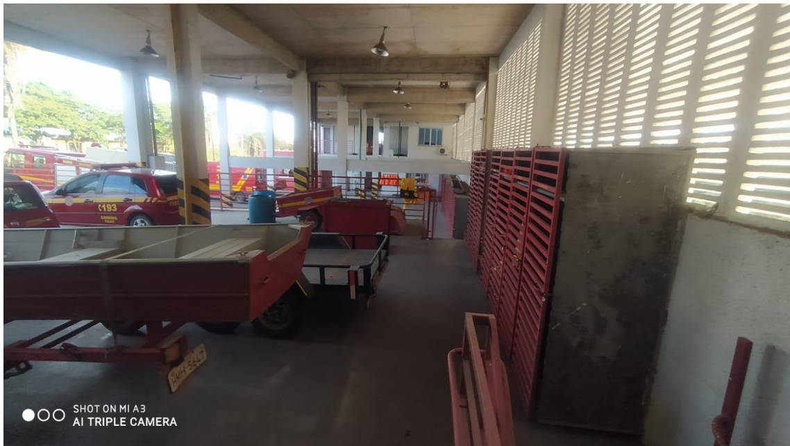
Figura 9 - Vista prontidão superior