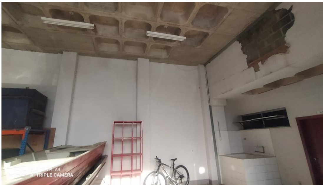
Figura 15 - Parede danificada, na garagem inferior