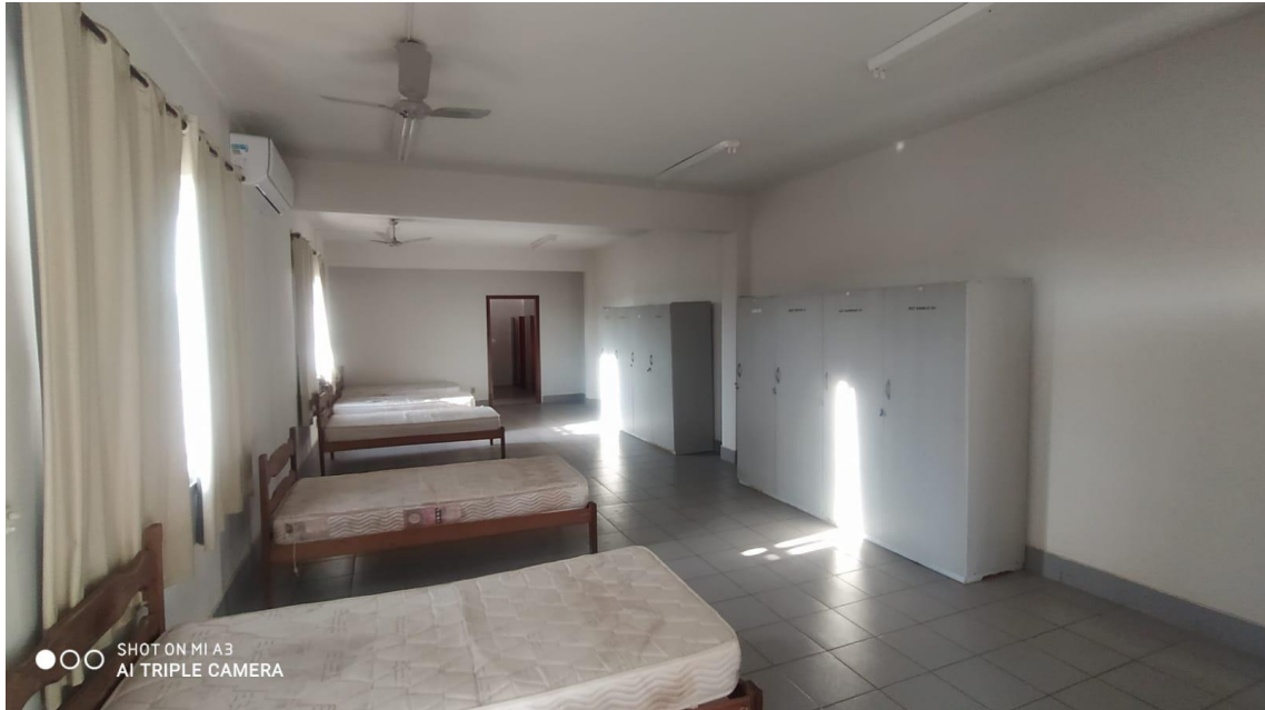
Figura 20 - Alojamento