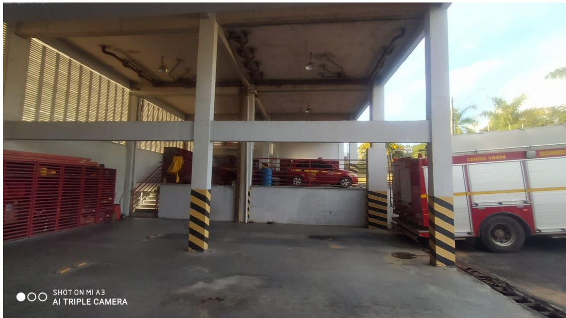
Figura 7 - Vista prontidão inferior/superior