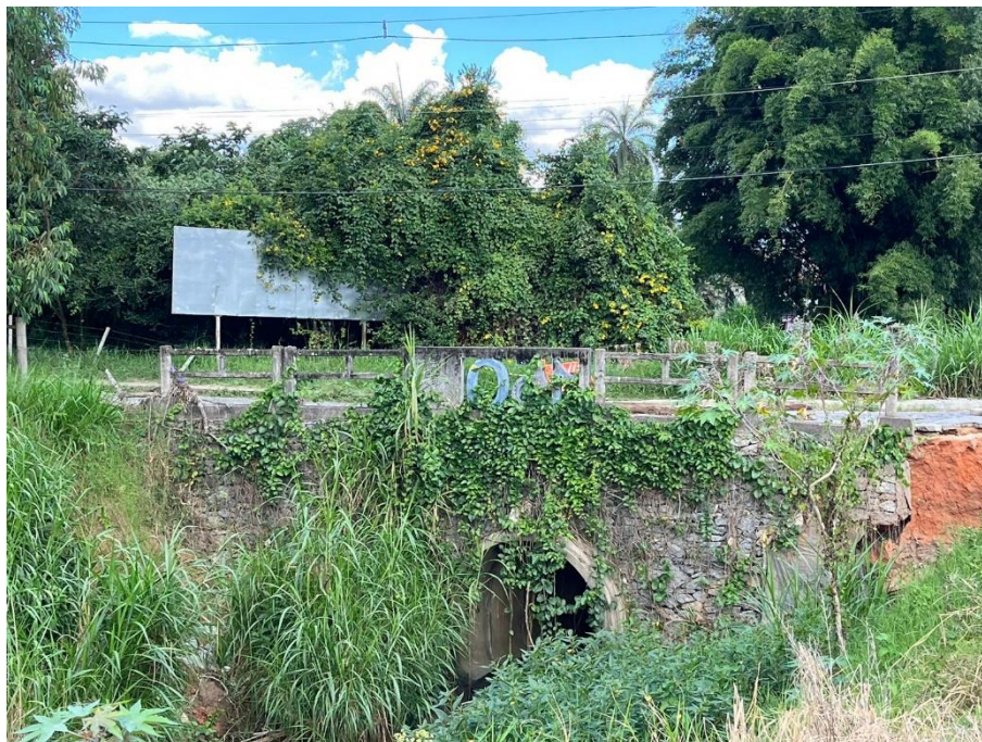
Figura 5 - Vista lado da jusante.