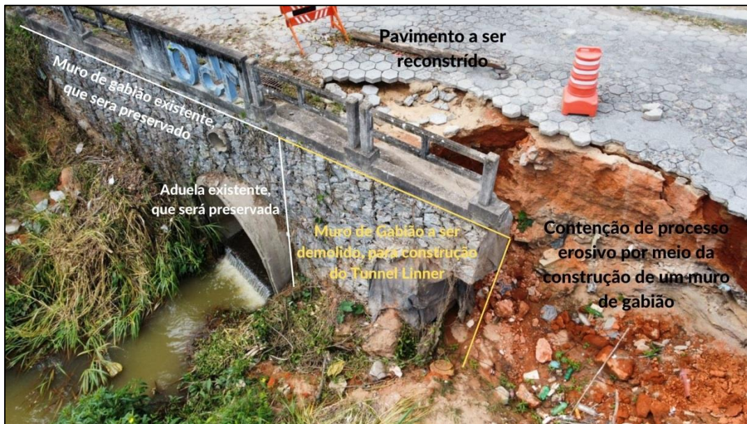
Figura 9 - Esquema das estruturas a serem recuperadas na ponte.