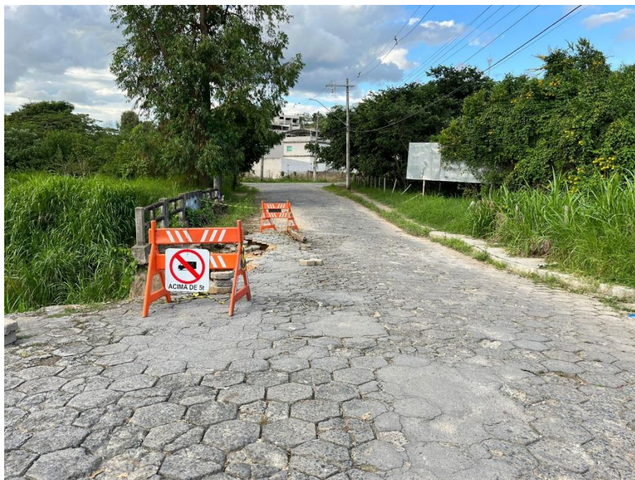
Figura 8 – Vista do pavimento.