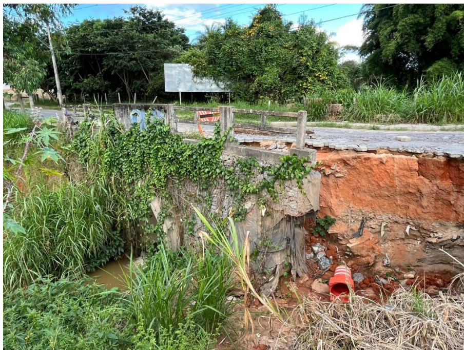
Figura 6 - Vista lado da jusante.