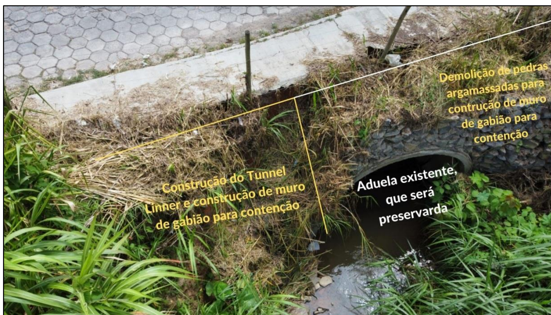
Figura 10 - Esquema das estruturas a serem recuperadas na ponte.