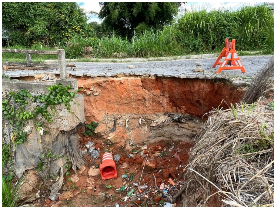
Figura 7 - Vista lado da jusante, processo erosivo