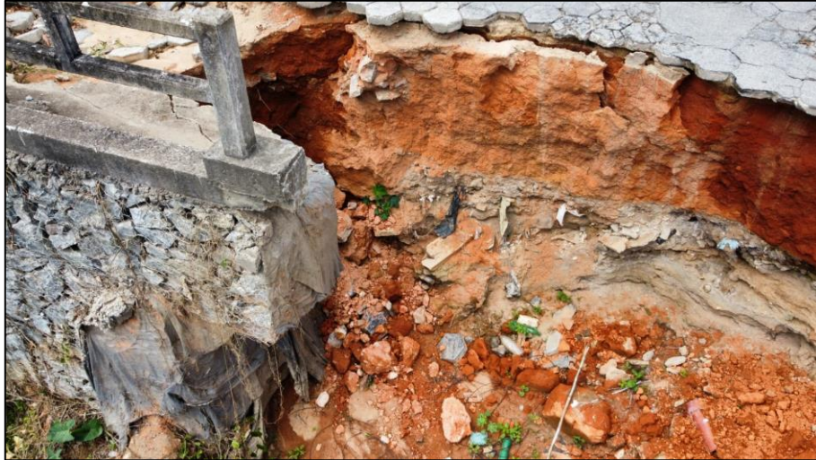
Figura 3 - Vista do processo erosivo.