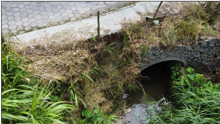
Figura 4 - Vista lado do montante.