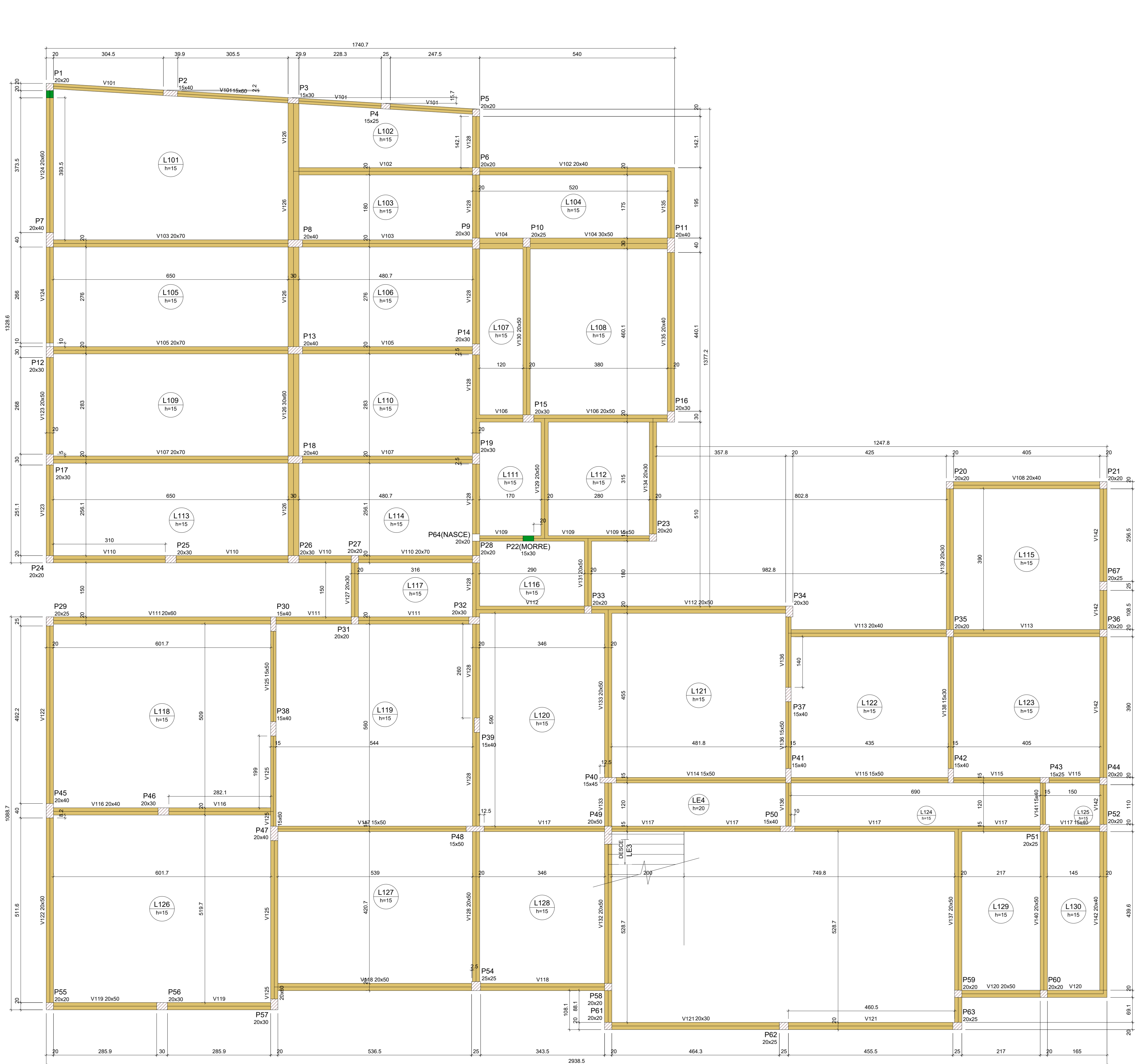
Forma do pavimento Térreo (Nível 357) escala 1:50