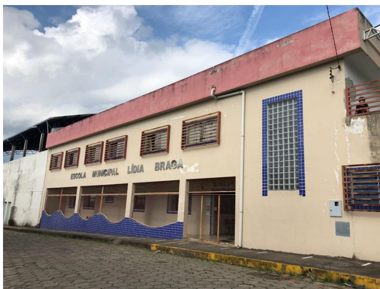
Imagem 1 - Fachada principal Escola Municipal Lídia Braga Rua Gislene Aparecida Mendonça.