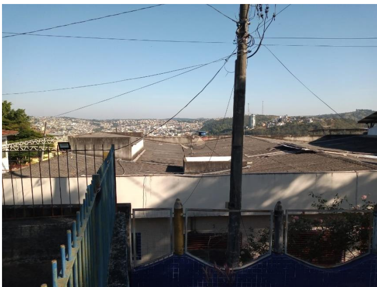
Imagem 5 – Telhado existente em telha amianto.