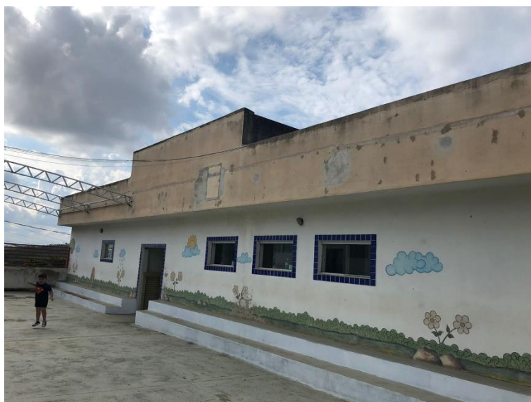
Imagem 2 – Fachada interna 2º pavimento Escola Municipal Lídia Braga.