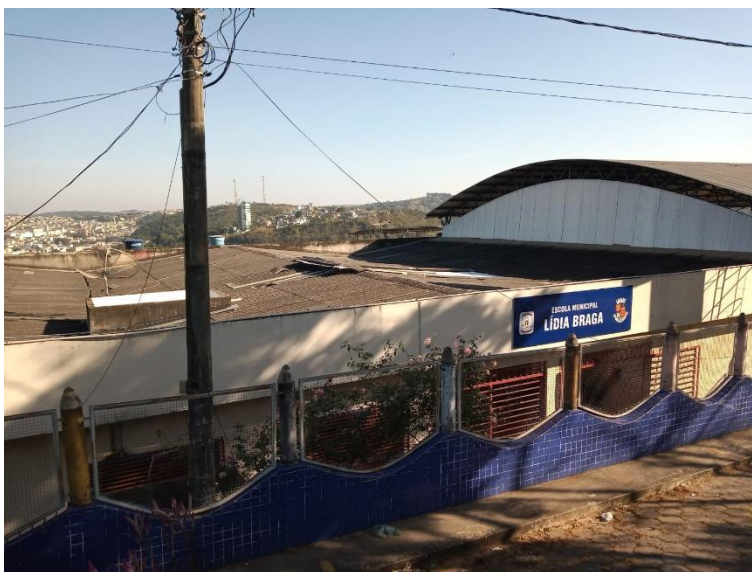
Imagem 3 – Telhado em telha amianto a ser reformado.