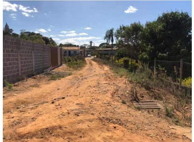
Imagens 5, 6 e 7– Rua José Pires de Almeida.