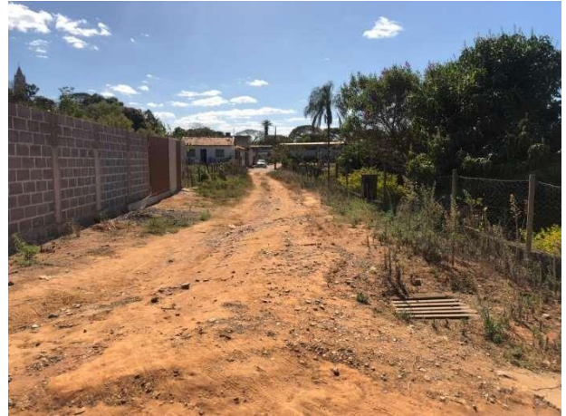
Imagens 5, 6 e 7– Rua José Pires de Almeida.