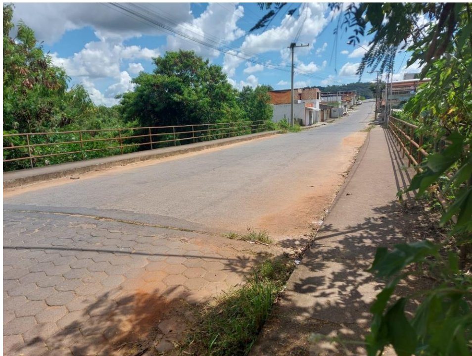
Foto 6: Vista do local onde será necessário ser instalada uma travessia de curso d'água no Rio Formiga.