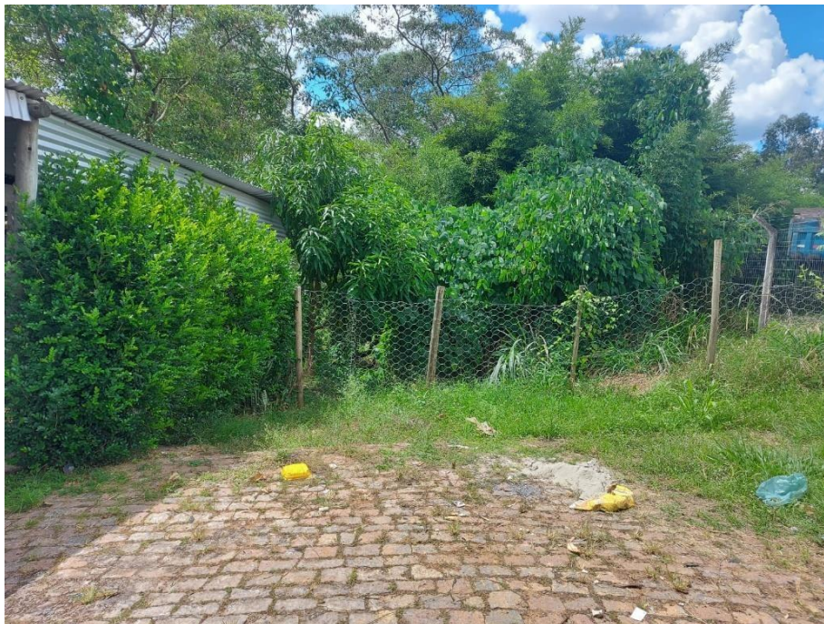
Foto 1: Rede interceptora de esgoto a ser implantada na margem do Rio MataCavalo, no final da Travessa Expedicionário.