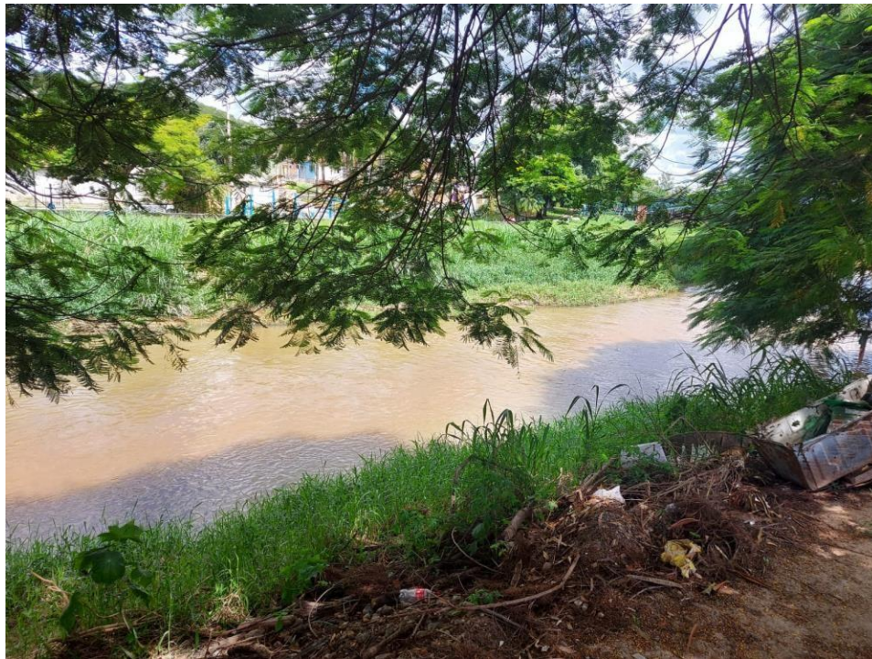
Foto 5: Vista do local a ser instalada uma travessia de curso d'água no Rio Formiga.