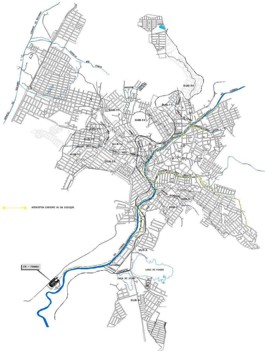
Figura 1 – Traçado da rede interceptora proposto no projeto original