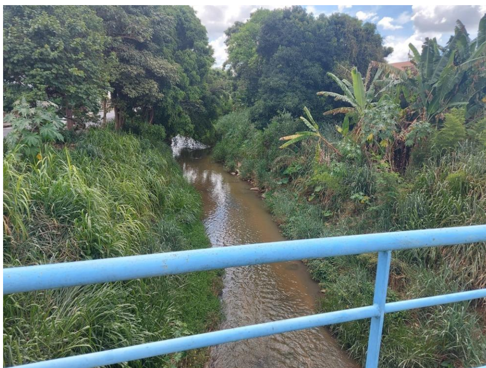
Foto 4: Local onde será instalada rede interceptora de esgoto às margens do RioMata Cavallo, próxima uma ponte localizada entre as Ruas Sete de Setembro e Rua dos Expedicionários.