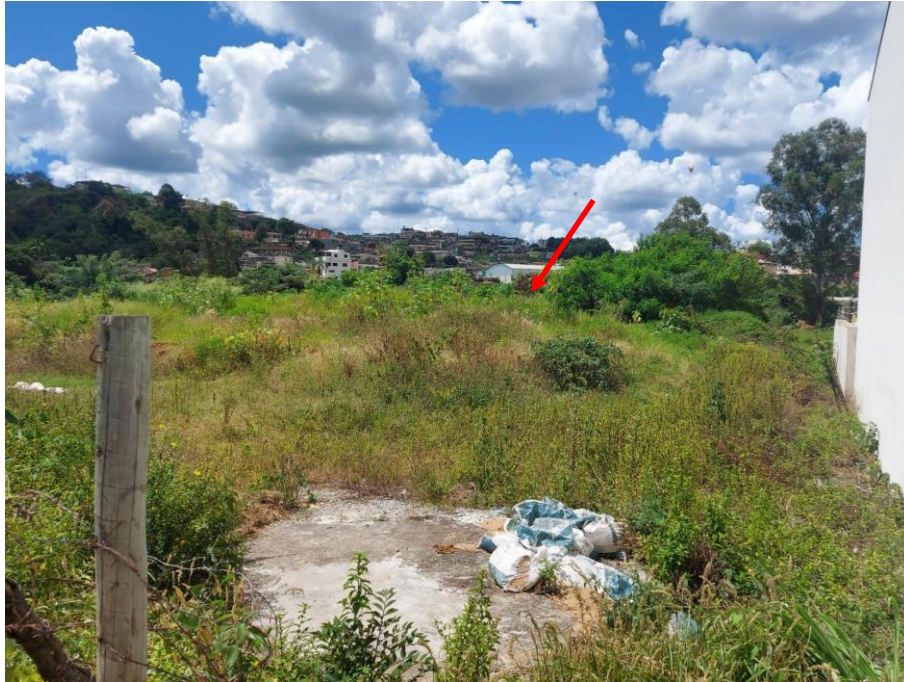
Foto 2: Seta indicando a localização de futura rede interceptora de esgoto, a ser instalada às margens do Rio Mata Cavallo, próxima a Rua do Expedicionário.