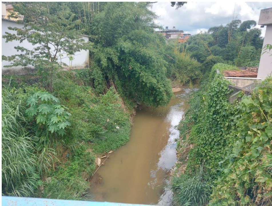
Foto 3: Local onde será instalada rede interceptora de esgoto às margens do RioMata Cavallo, próxima uma ponte localizada entre as Ruas Sete de Setembro e Rua dos Expedicionários.