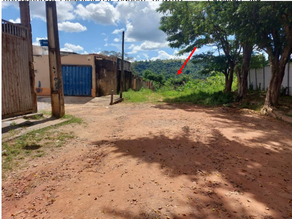
Foto 7: Seta indicando o local a ser instalada uma travessia em curso d'água no RioFormiga e também a estação elevatório de esgoto.